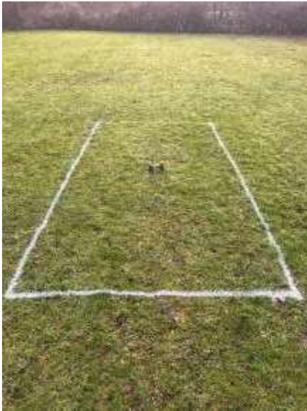
Rechteck 2x4 m